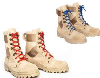
Ботинки с высокими берцами утеплённые бежевого цвета со шнурками красного (синего, бежевого) цвета