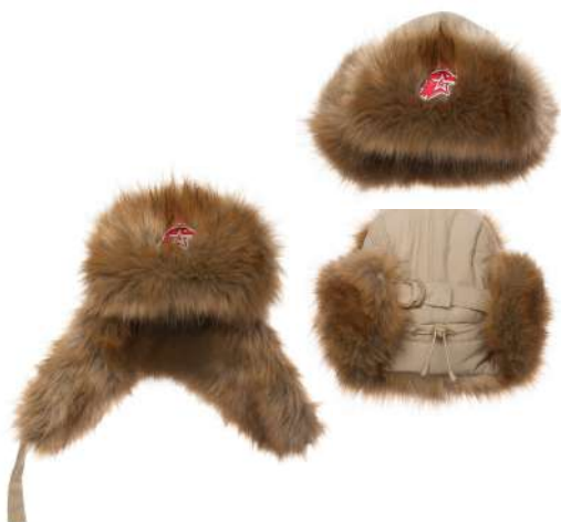
Шапка-ушанка бежевая с искусственным мехом коричневого цвета