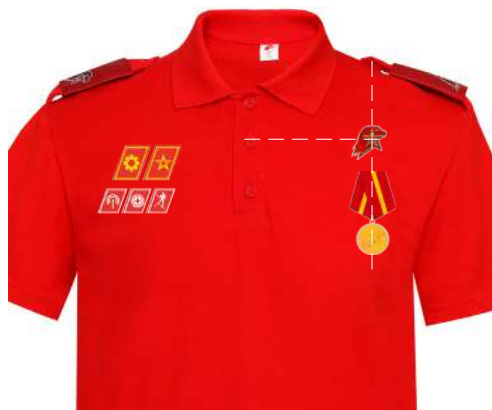
Размещение знаков различия, знаков отличия и иных геральдических знаков на рубашке поло красного (синего) цвета