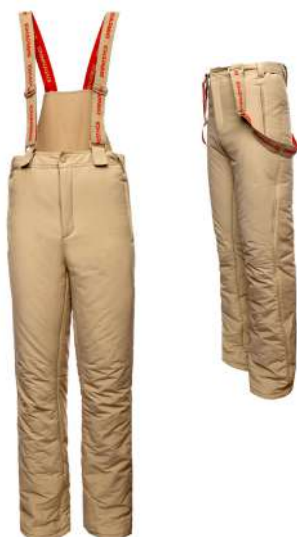
Брюки утеплённые (тактические) бежевого цвета