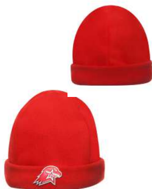
Шапка флисовая вязаная красного цвета