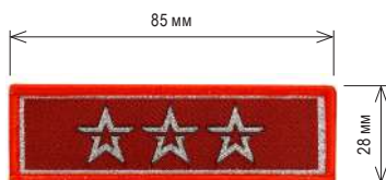
Нарукавный знак, определяющий принадлежность к ВВПОД «ЮНАРМИЯ»