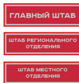
Нарукавный знак, устанавливающий принадлежность к структуре органов ВВПОД «ЮНАРМИЯ»