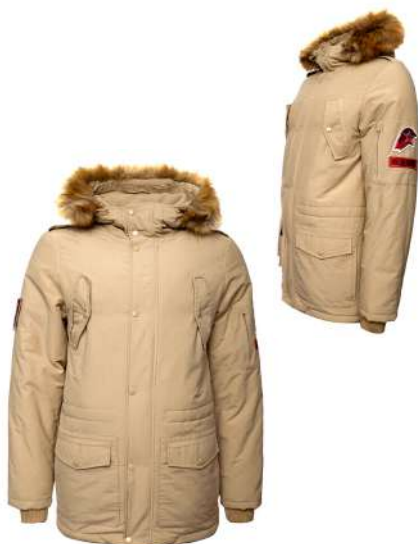
Куртка зимняя утеплённая бежевая с капюшоном и отделкой к капюшону из искусственного меха коричневого цвета