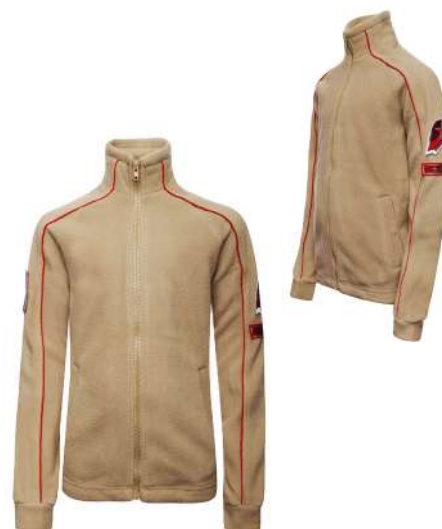
Жакет флисовый бежевого цвета