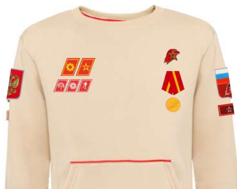
Размещение знаков различия, знаков отличия и иных геральдических знаков на толстовке бежевого цвета