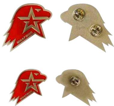
Большая (кокарда) и малая (значок) эмблема ВВПОД «ЮНАРМИЯ»