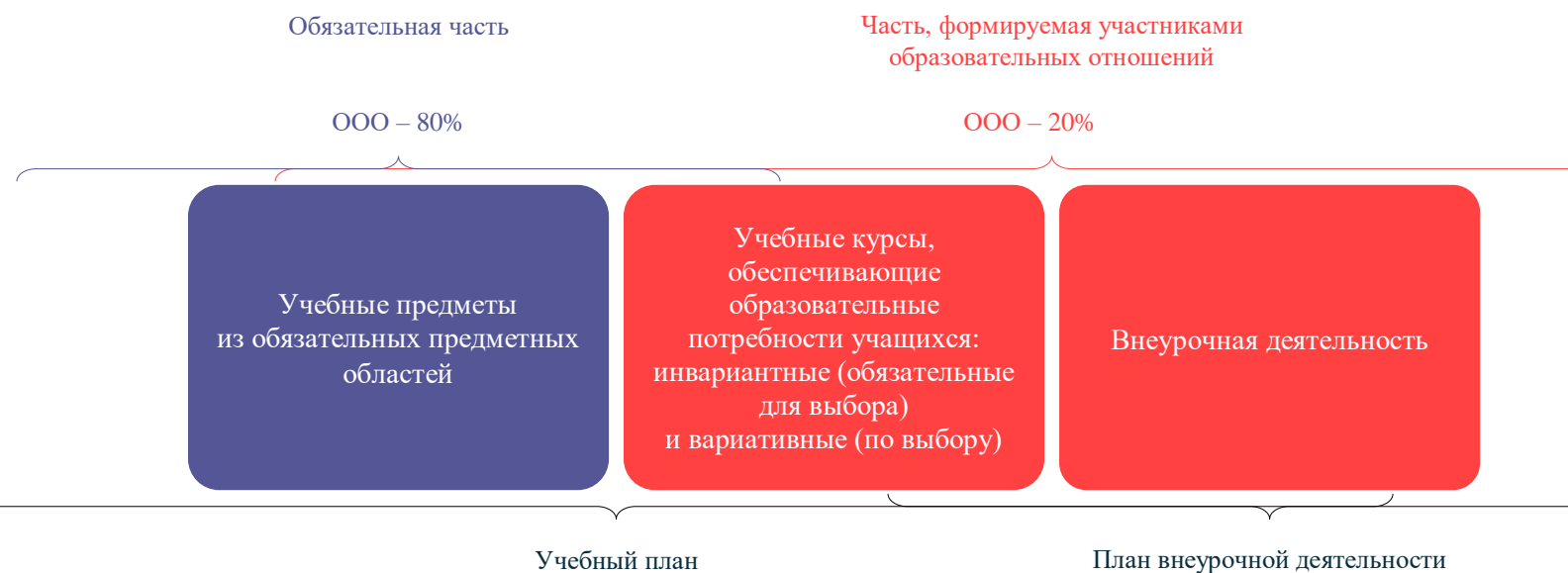
Схема 1. Части основной образовательной программы

Обязательная часть представляет собой совокупность учебных предметов из обязательных предметных областей. Формируемая часть представляет собой инвариантные (обязательные для выбора) и вариативные (по выбору) курсы учебного плана и курсы внеурочной деятельности (схема 1).